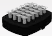
Schaumstoff für Mikroröhrchen