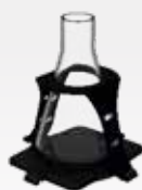
Gummihalterung für Kolben